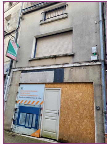
22 place du Marché

Rapport d'orientation budgétaire 2026 (Conseil municipal du 16-12-2025)